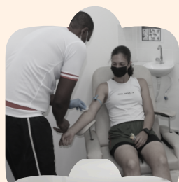
Exames de Sangue