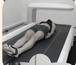
Composição Corporal por DXA